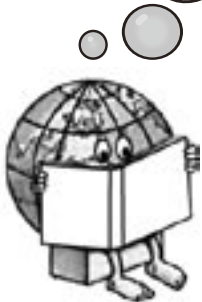
UNESCO ESD マスコット「DDくん」