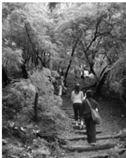
ソンミ山。気持ちのよい雑木林を登ると、眺めのよい山頂。そこは開発業者が一夜にして2000本の樹木を伐採してしまった成れの果ての姿。その日から交代で見張りをした反対運動のテントが今も残る。

その後、就学後の子どもの放課後の居場所「夢の場」もでき、組合員だけでなく地域の誰もが過ごせる場となる。そして、子どもが暮らしやすい環境は地域全体でつくっていかうという考えのもと、2001年に「麻浦ドゥレ(=助け合い)生協」は生まれた。