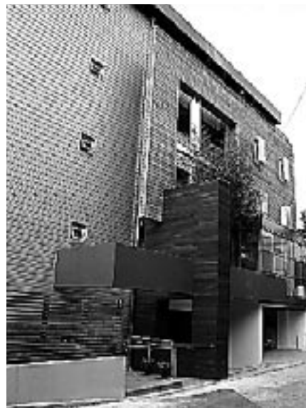
ソンミ山学校。国産材利用で、教室はすべてオンドル暖房!各教室のほか音楽室、メディア室、食堂などがある。中庭はあるが、ソンミ山や河川敷の公園が子どもたちの運動場だ。

現在の課題は、質の高い教育を子どもたちに受けさせるための教師の確保という。父母や住民が選んだ教師は、常勤12名、科目別に40名、アドバイザー(地域住民や専門家)30名。彼らは一方的に教室の中で教えるだけではなく、まちに