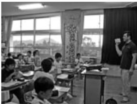
愛知県の小学校での授業風景

これを円滑にすすめ、京都議定書の目標を達成しようと思えば、国産材の利用量が毎年2,500万m 3 必要なのですが、昨年の国産材の利用量の実績は残念ながら約1,700万m 3 にとどまっているのが現状、これでは森林整備に必要な資金を森へ還流していくことが不十分となってしまいます。